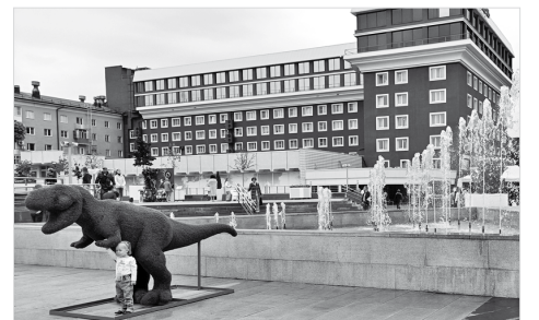
Ставрополь – город, привлекательный для туристов

Развитие туризма, в отличие от большинства отраслей материального производства, предполагает сохранение и расширение потребности в трудовых ре-