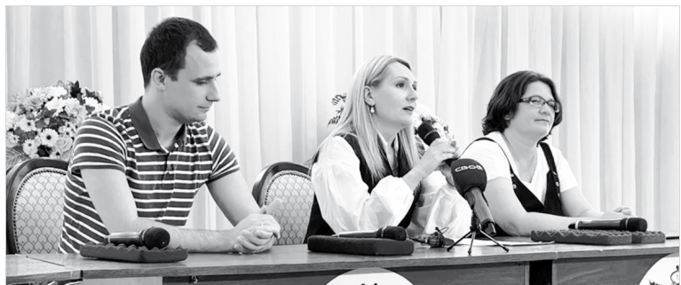
На пресс-конференции журналистам рассказали о программе «Музыкальной осени Ставрополя – 2023»

В нынешнем году в нашем регионе будет традиционно проходить Международный фестиваль «Музыкальная осень Ставрополя» . Это по-настоящему большое событие, фестиваль состоится в начале следующего месяца – с 1 по 5 октября включительно.