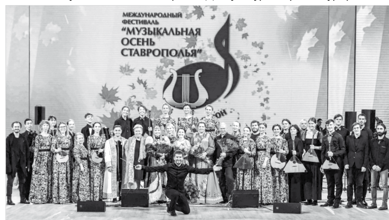
Каждый год фестиваль проходит масштабно

Кристина ЛИМАНОВА.