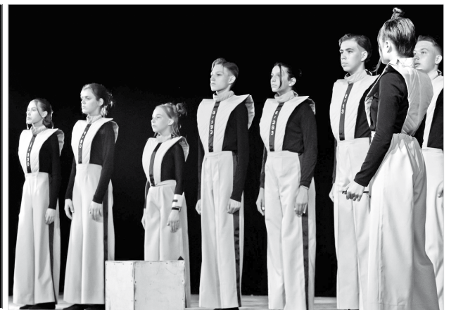
Сцена из спектакля «Мы»